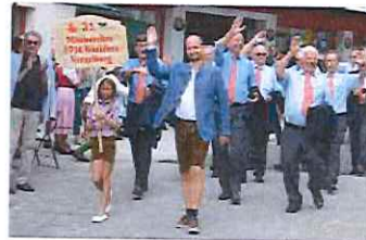
Beim Umzug: Der Männerchor Nüziders aus Vorarlberg.