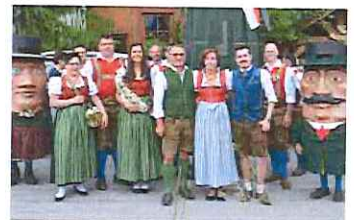
Samson und Zwerge tanzten für die Eigentümerfamilie.