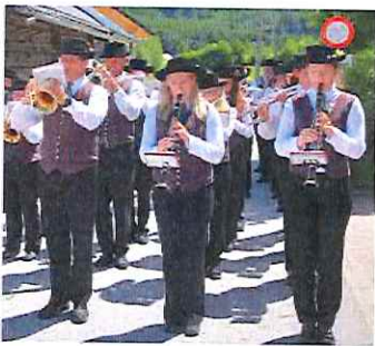
Natürlich mit dabei: Die Musikkapelle von St. Andrä.