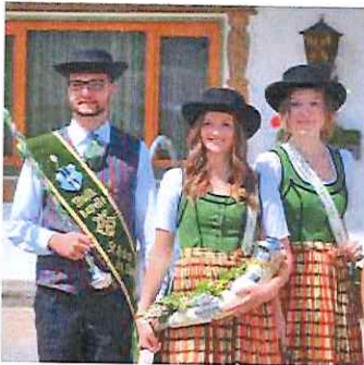
Fesch: Der Stabführer und die Marketenderinnen.