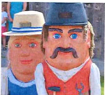
Zwerge, die treuen Samson-Begleiter.